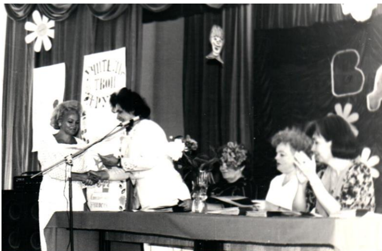
Вручение дипломов выпускникам заочного дошкольного отделения 1993-1994 уч.г.