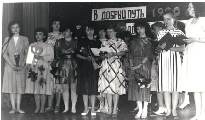
Ответное слово выпускников дошкольного отделения на вручении дипломов. Июнь, 1990г.