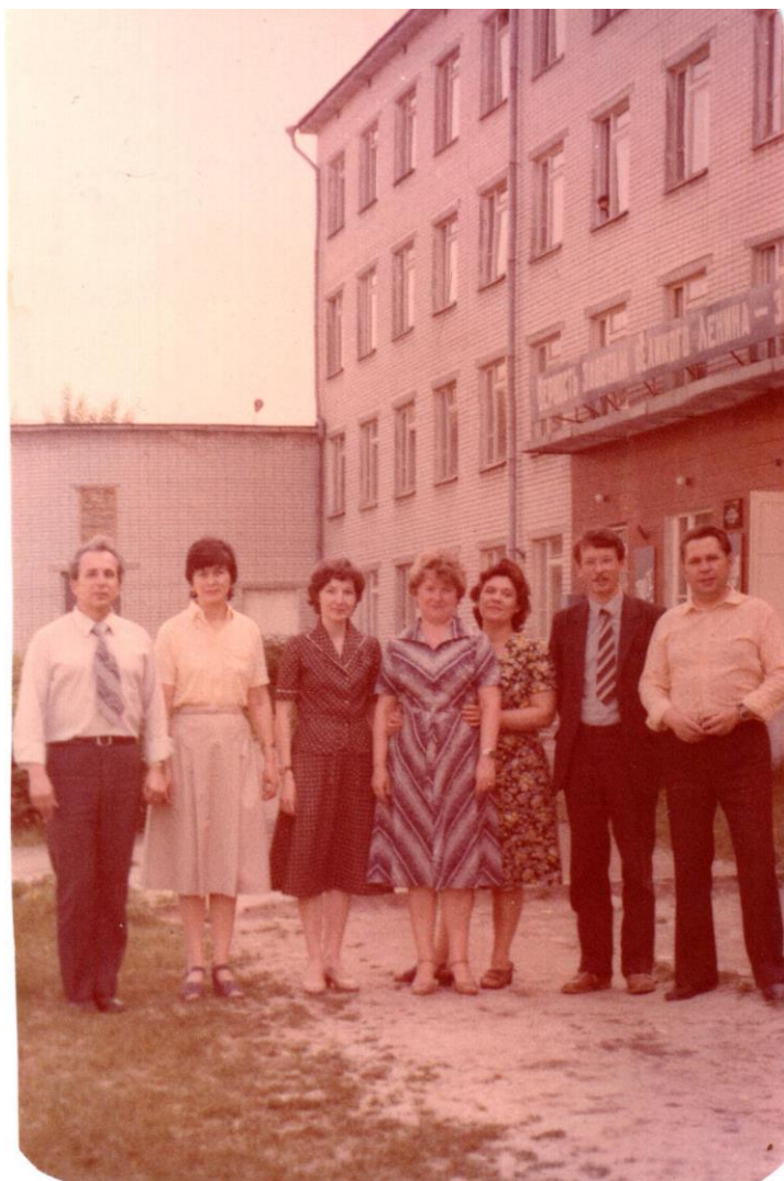
Коллеги из Казанского педучилища и члены комиссии Министерства просвещения РСФСР (первая проверка педучилища, после которой мы стали «Отличниками просвещения РСФСР»). Май, 1983-1984 уч.г.