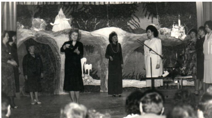
Администрация педучилища поздравляет коллектив с 10-летним юбилеем. Октябрь, 1991г.