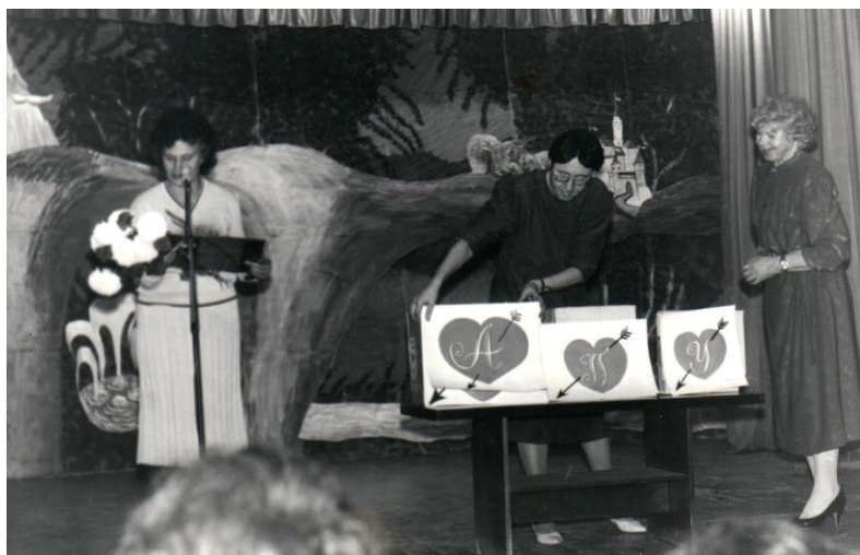
1991г. 10-летие нашего учебного заведения. С юбилеем нас поздравляют коллеги из Арского педучилища