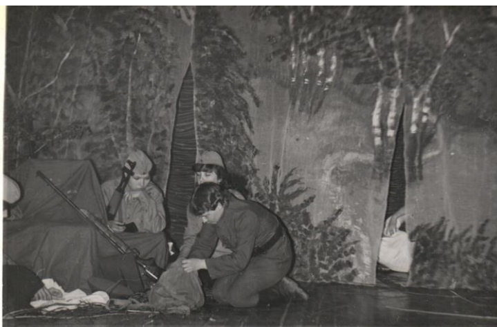
Фрагмент из спектакля «А зори здесь тихие...» (руководитель З.Ш. Бухараева)