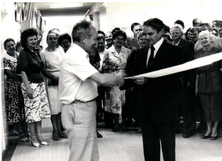
Официальное открытие музея народного образования при педагогическом училище