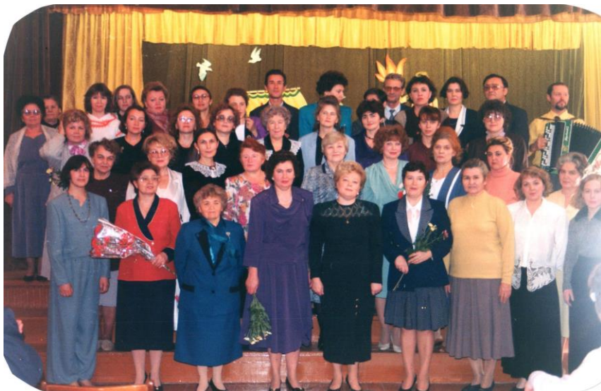
Коллектив Нижнекамского педагогического училища. Встреча по случаю 15-летия учебного заведения. Ноябрь, 1996г.