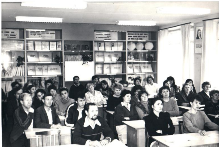
Торжественное заседание, посвящённое 120-ой годовщине со дня рождения В.И. Ленина