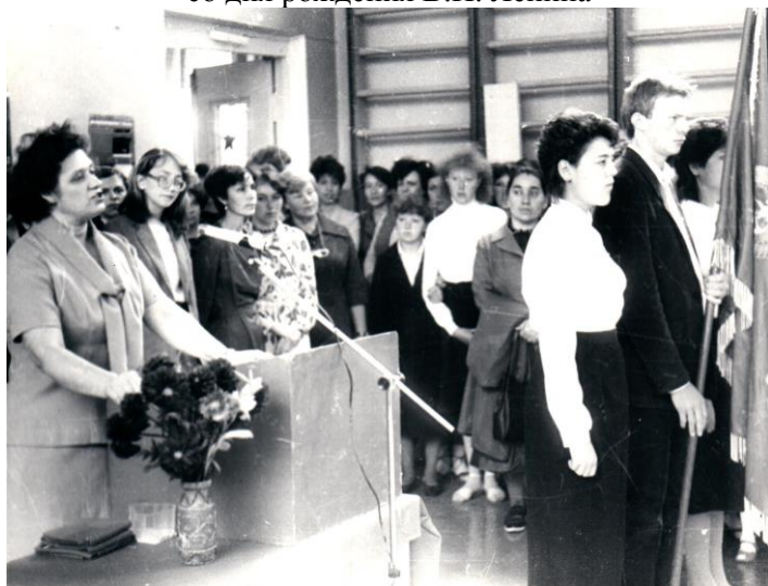
Торжественная линейка, посвящённая празднованию 73 годовщине Великого Октября. 1990г.